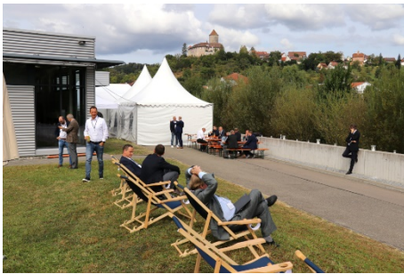
Der großzügige Außenbereich vor dem MBO-Showroom ermöglichte Diskussionen in ruhiger Atmosphäre.