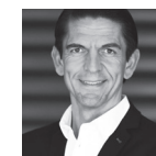
Deniz Aytekin Schiedsrichter & Online-Unter- nehmer